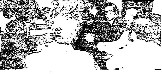
الوزير سامان في لقائه مع الطلاب

بمعرفة طراد ، رئيس كلية الطلاب ، وأمر العمل على سحب ملفات الطلاب من العلوم الأولى ليعاد إلى بحث الخطوات اللاحقة .